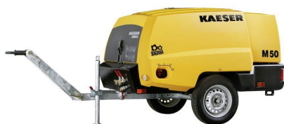
Компрессор Kaeser M50 (Германия)