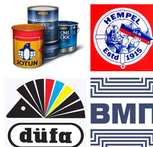
Лакокрасочные материалы Jotun, Hempel, Dufa, ВМП