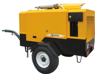
Компрессор Remeza 10/10 (Республика Беларусь)