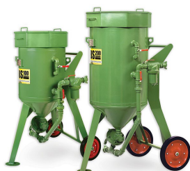
Пескоструйное оборудование Contracor (Германия)