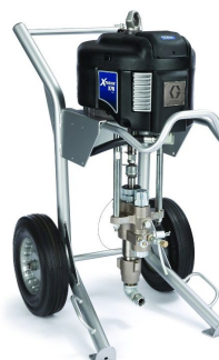
Окрасочные аппараты GRACO XTREME (США)