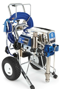
Окрасочные аппараты GRACO MARK V (США)