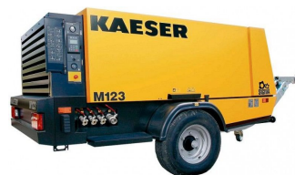
Компрессор Kaeser M123 (Германия)