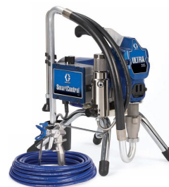
Окрасочные аппараты GRACO ST MAX (США)